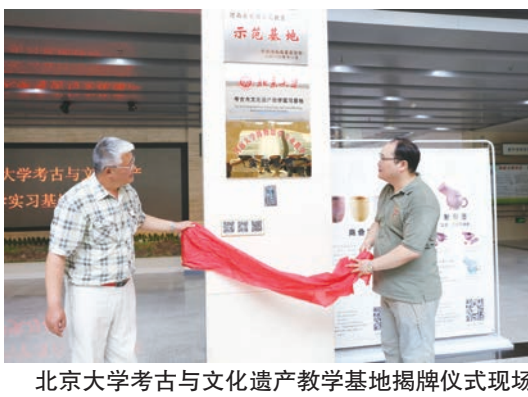
北京大学考古与文化遗产教学基地揭牌仪式现场