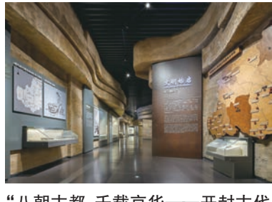
“八朝古都 千载京华——开封古代历史文化陈列”展厅