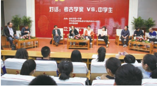
“对话：考古学家 VS. 中学生”活动现场