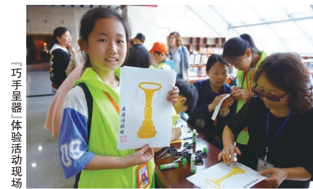
“巧手呈器——体验活动现场”