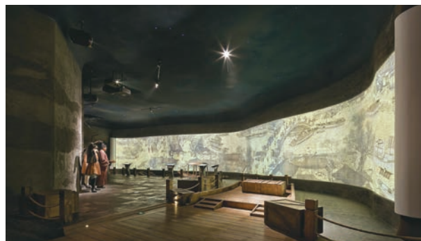
“清明上河图专题展”展厅