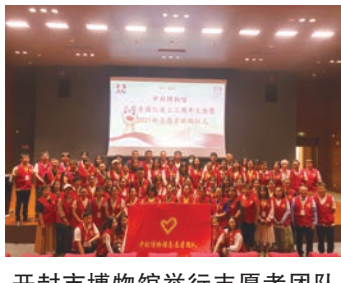
开封市博物馆举行志愿者团队成立三周年大会现场