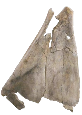
“岁于中丁刻辞卜骨”