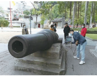
采集革命文物信息

革命文物在国家文物资源体系中占据重要地位,是继承革命文化和开展爱国主义教育的重要载体。广东省博物馆发挥省级综合博物馆的排头兵作用,扎实做好新时代革命文物工作。广东省博物馆运用SaaS、服务总线、可移动文物多级数据采集、空间虚拟成像、大数据、人工智能等先进技术手段,创新革命文化弘扬与传承模式,打造广东省可移动革命文物数字化保护利用平台。平台在2021年9月开始建设,并于2022年3月建设完成,充分践行新时期红色文化遗产保护、传承与发展的重要使命,树立起大湾区红色文化数字化保护传播的示范性标杆。