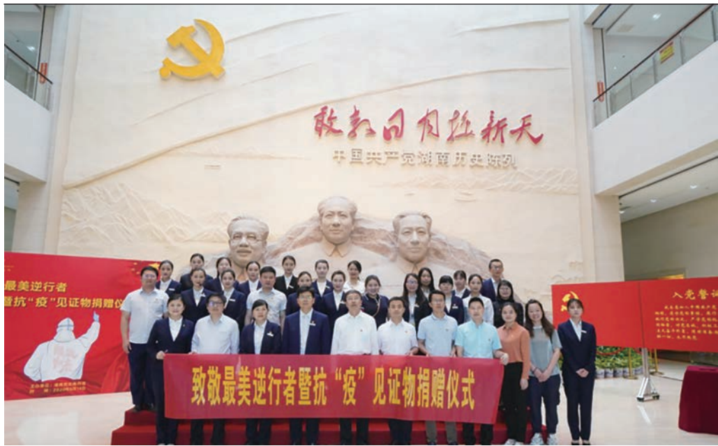
湖南省对口支援黄冈医疗队见证物捐赠仪式