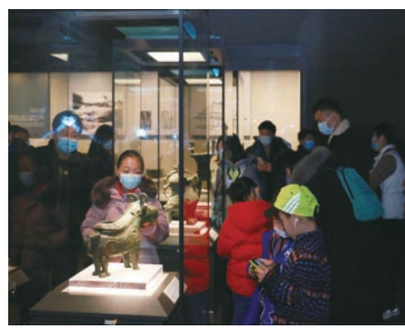
观众参观基本陈列“泱泱华夏 择中建都”