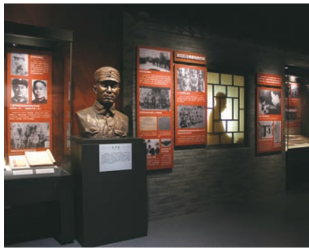
“出彩中原——河南红色文化陈列展”展厅