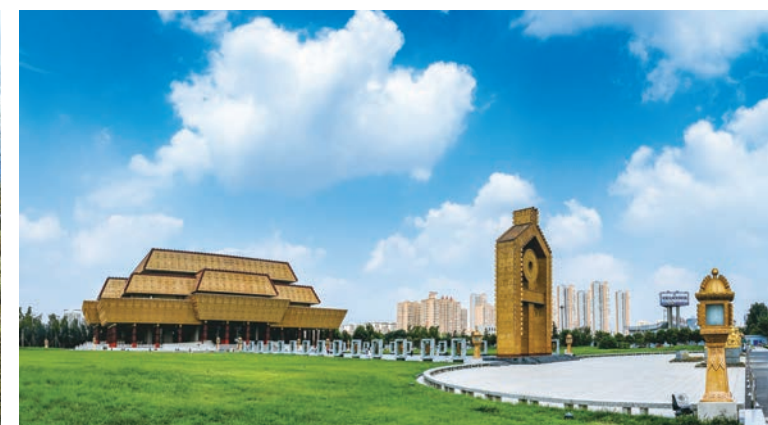
中国文字博物馆一期实景图