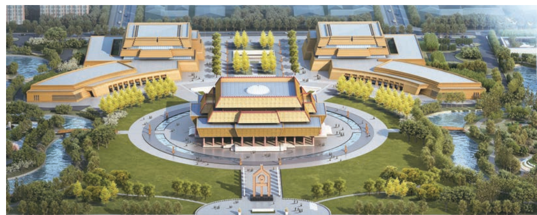
中国文字博物馆全景效果图

为扩大博物馆影响力，提升学术水平，实现学术研究和教育交流的文化价值，中国文字博物馆先后聘请冯其庸、李学勤、黄德宽为馆长，聘请饶宗颐、裘锡圭等一批国内外知名学者为学术顾问，并成立了中国文字博物馆学术委员会，通过组织举办学术研究和活动，加强对外文化交流与合作，实现了学术研究工作高起点起步，先后成功举办了“中国文字发展论坛”“中国文字·书法论坛”等学术研讨活动40余场；出版《绝学新知》《甲骨文常用字典》《文字源流》等学术专著20余种。2016年开始，受全国社科规划办和河南省委宣传部委托，中国文字博物馆承担国家社科基金重大项目“大数据、云平台支持下的甲骨文考释研究”和“甲骨文释读优秀成果评选奖励”的组织实施工