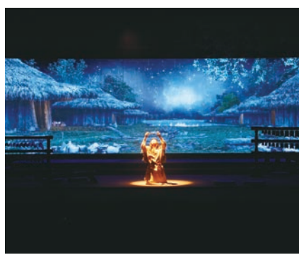
华夏古乐演出场景