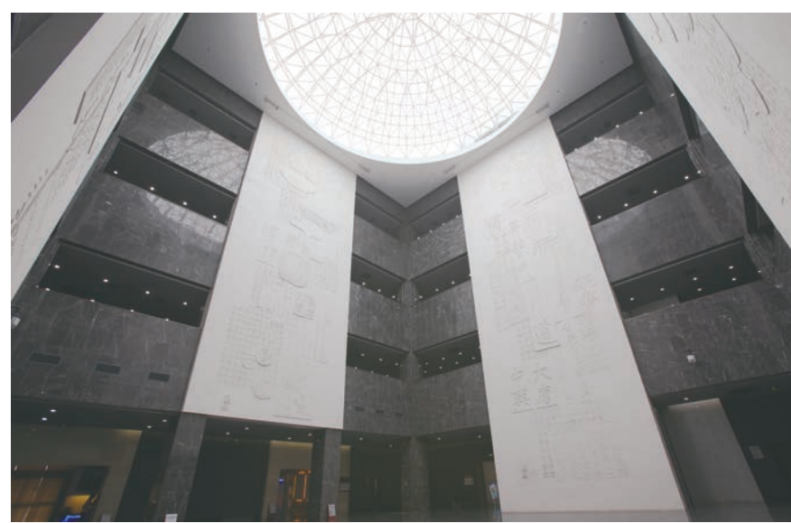
中国文字博物馆序厅